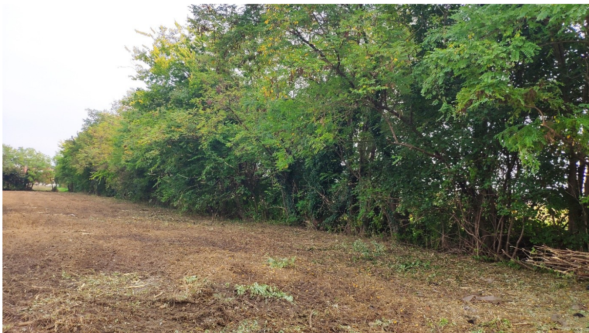
Vista ravvicinata della siepe di Robinia centrale all'ambito

L'area confina a nord con via Francia. Trattasi di ambito pianeggiante, inserito ai margini di un'area in trasformazione insediativa. La porzione Ovest dell'ambito è attualmente incolta, quella Est è invece coltivata a seminativo. Centralmente all'ambito è presente una siepe a prevalenza di robinia ( Robinia pseudoacacia ) che prosegue verso Nord, oltre il limite dell'area in progetto.