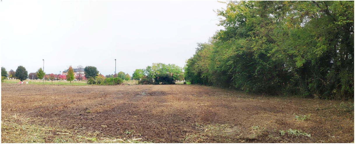
Vista generale verso Nord della porzione Ovest dell'ambito