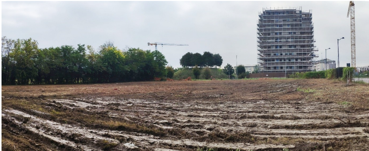
Vista verso Sud della porzione Ovest dell'ambito

Mauro Dott. D'AMBROSIO MAURO N° 249 ALBO INGEGNERI AGRONOMI E DOTTORI FORESTALI - TREVISO -