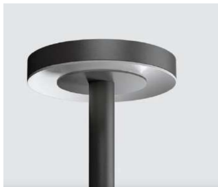
Cariboni group EKLEIPSIS TESTA PALO Lampione da giardino a LED