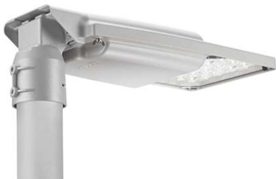
Armatura Stradale: Koinè della Cariboni

Tutti i corpi illuminanti devono essere conformi alle norme CEI 34-21, 34-22, 34-23 e secondo quanto indicato all'articolo 133 della Norma CEI 64-8. Per le nuove apparecchiature a LED scelte si individua l'apparato con scheda per il controllo automatico.