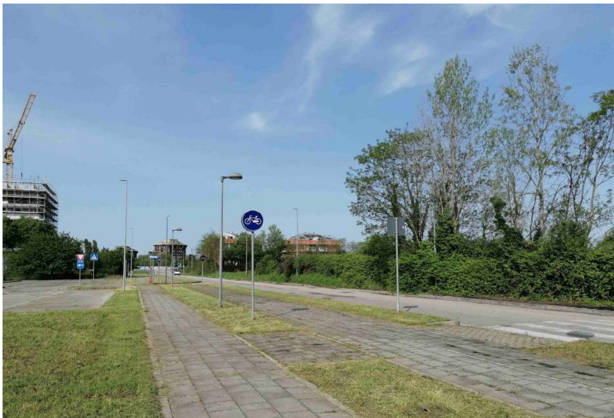
1 vista da sud