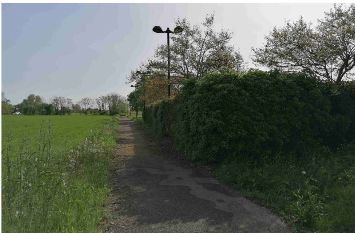
4 vista della ciclabile a nord