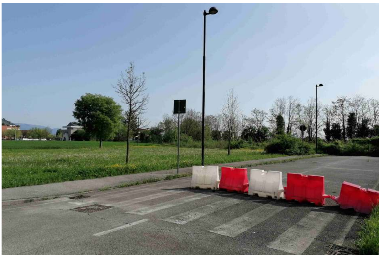
3 vista interna dell'area verso nord-est