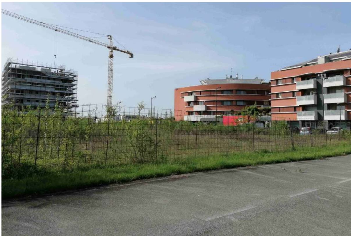
2 vista interna all'area verso sud-ovest