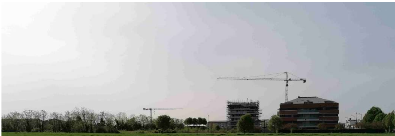
5 vista da nord