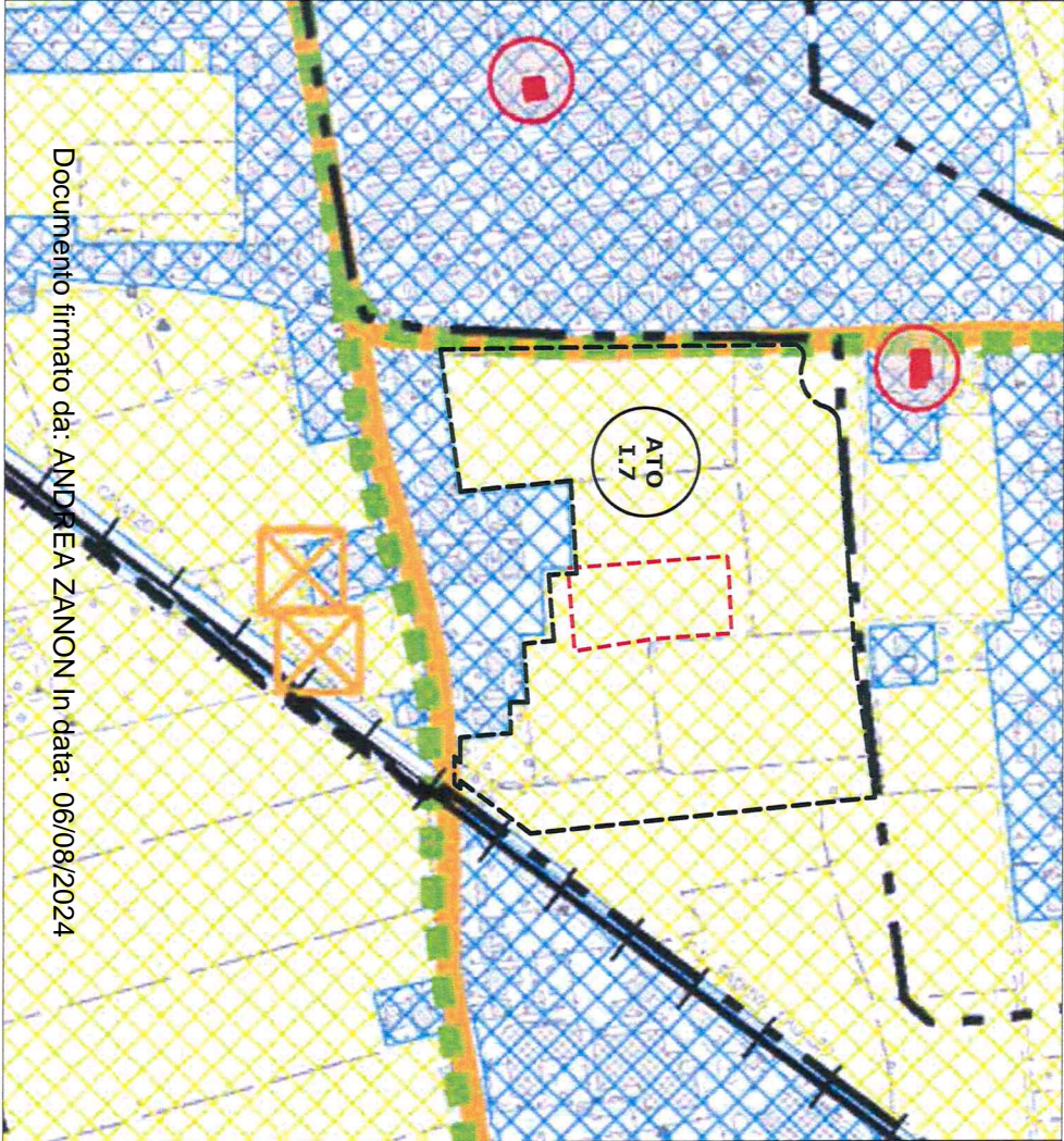
Estratto di P.A.I. Tavola della Trasformabilità - febbraio 2014 - Tav. 4.b Scala 1:5000