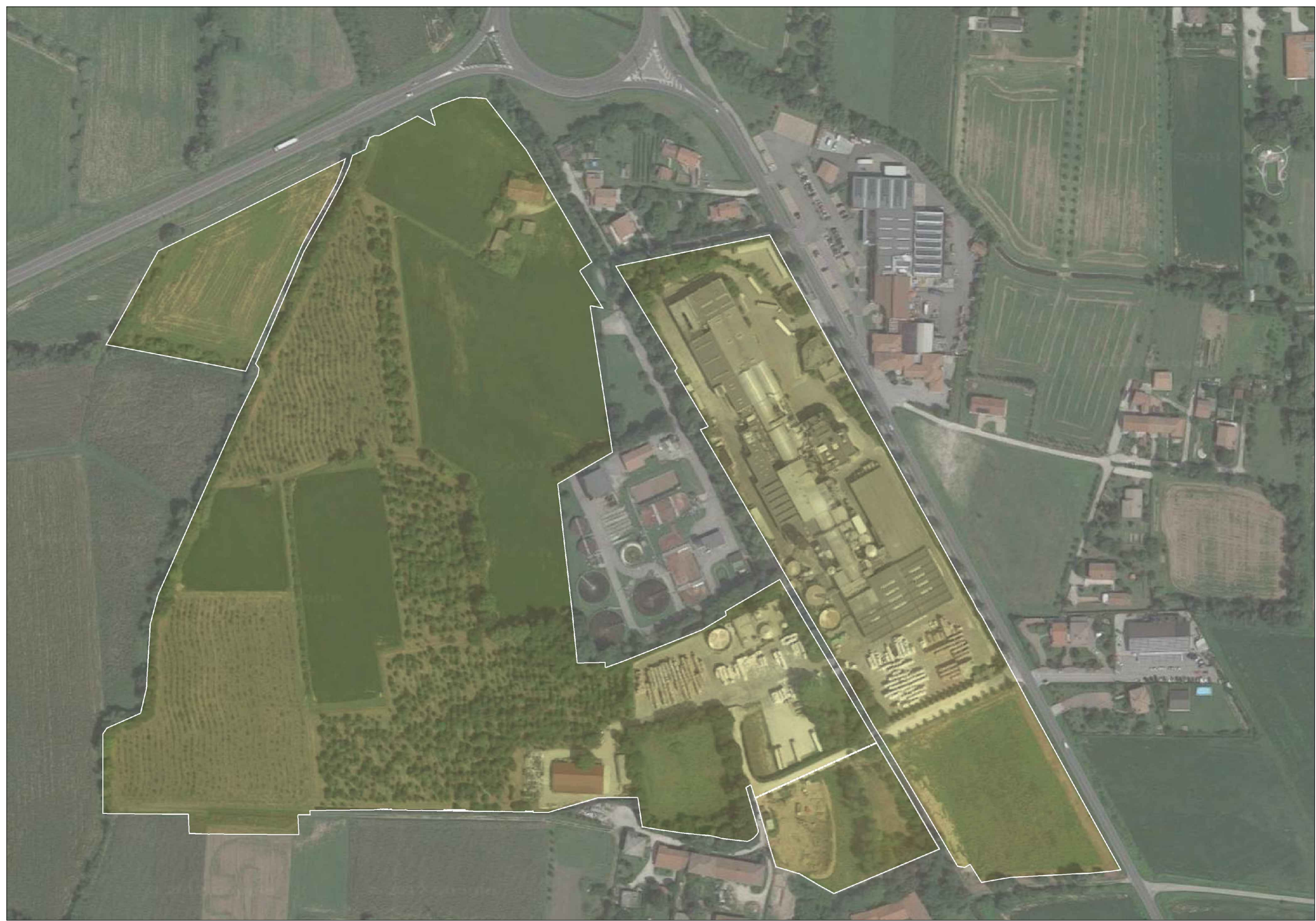
ORTOFOTO CON INDICAZIONE DELLA PROPRIETA' CARTIERA GIORGIONE S.P.A.

F9; -CB9'J9B9HC 7 CAI B9'8=75GH9@F5B7C'J" DFCJ-B7-5'8=HF9J-GC